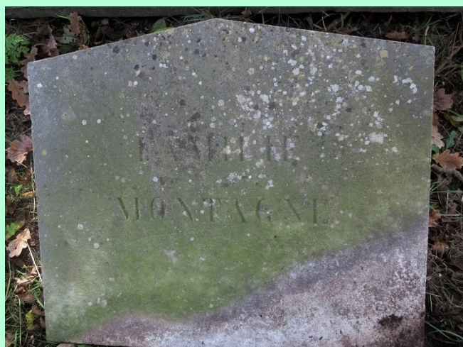
Graf 109C (Familie Montagne)