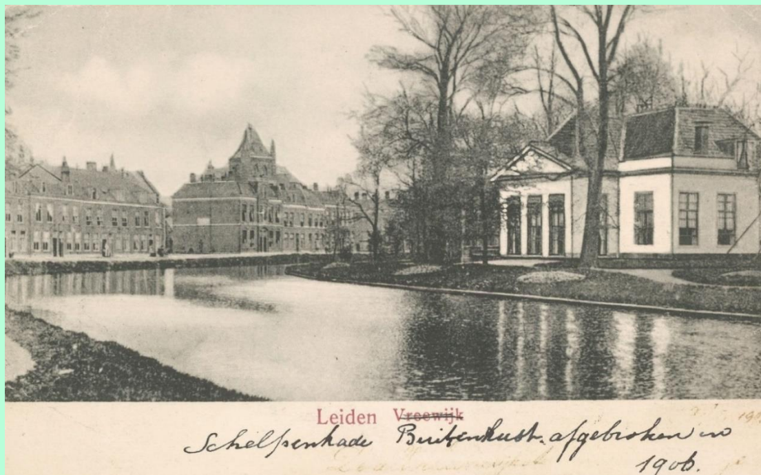
Het buitenhuis bij de Schelpenkade