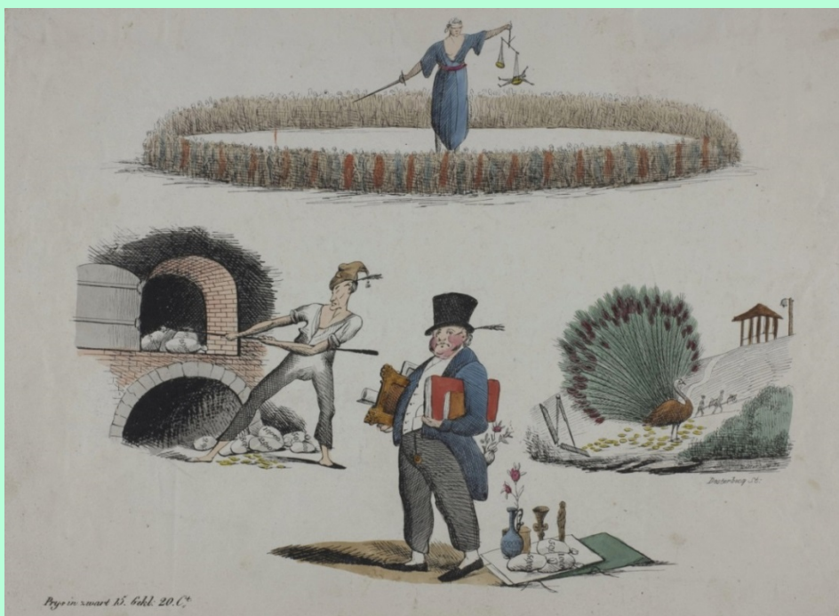
Spotprent met Backer als 'bakker, die zakken geld uit de over haalt', Van der Paauw als 'pauw met meetwerktuigen' en Seyn als 'man met hoge hoed, op sloffen en met boeken en schilderijen onder de arm'; bovenin een 'gerechtigheid omgeven door veel volk'