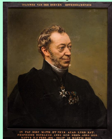
Portret Jan van der Hoeven

Eind 1867 krijgt hij longproblemen en net als zijn gezondheid wat beter lijkt te worden, overlijdt hij op 10 maart 1868.