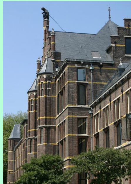
Rijksmuseum van Natuurlijke Historie aan de Raamsteeg

Art 3: Hij regelt, in overeenstemming met den directeur en behoudens goedkeuring van curatoren, de dagen en uren ter bezigtiging van het museum.