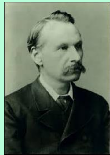
Portret Emile Seipgens

Van jongs af aan schrijft Emile Seipgens gedichten. In 1855 richt hij, samen met twee andere jonge dichters, het Letterkundig Genootschap 'De Lelie' op. Hij schrijft zowel in het Nederlands als in het Roermonds dialect, maar publiceert weinig. Zijn bekendste werk is het libretto dat hij schrijft voor de opera-bouffe ' Schinderhannes ', die in zijn geboorteplaats Roermond nog steeds eens per zeven jaar wordt opgevoerd. In 1896 overlijdt hij na een half jaar ziek te zijn geweest