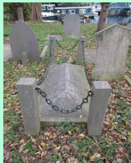
Graf Seipgens op Groenesteeg

In het Leidsch Dagblad van 30 juni 1896 verschijnt het volgende ingezonden bericht: