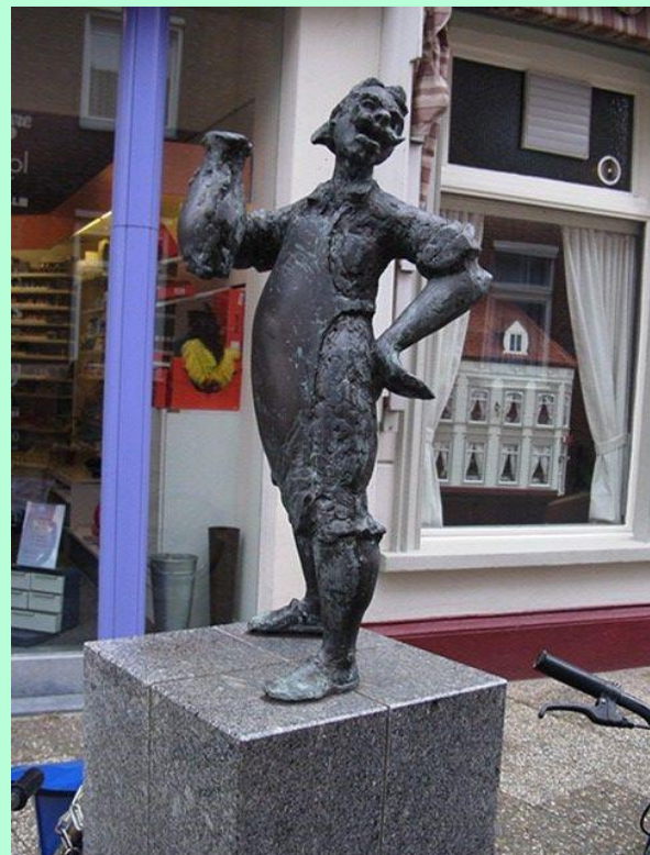
Bronzen beeld Schwarze Peter