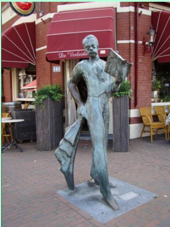
Bronzen beeld Emile Seipgens

In de binnenstad van Roermond is een beeldenroute uitgezet, met de personages uit de opera-bouffe, die begint bij de Steenen Brug met een beeld van Emile Seipgens zelf.