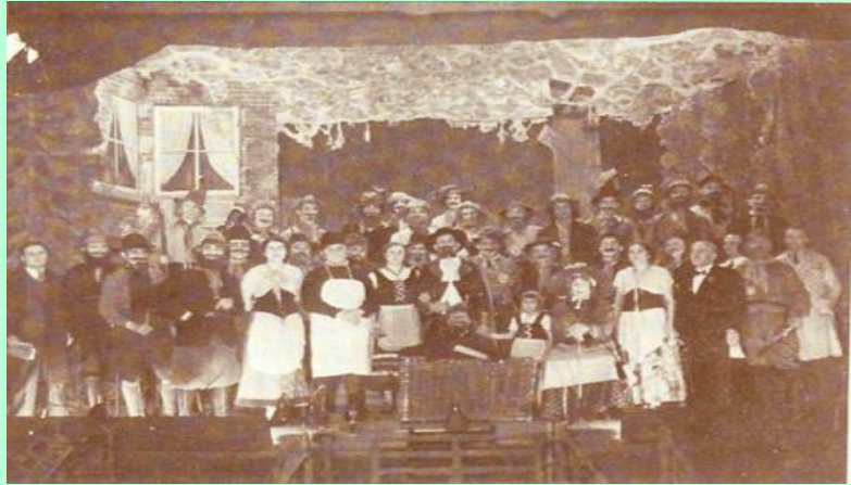
Tableau de la troupe 1939

De opera is sinds 1865 vele malen in Roermond uitgevoerd, tot op de dag van vandaag. Recente versies zijn op film vastgelegd. Er zijn liederen uit het stuk die tot het vertrouwde repertoire van menig Roermondenaar zijn gaan behoren en die bij bruiloften en partijen luid worden meegezongen of geparodieerd.