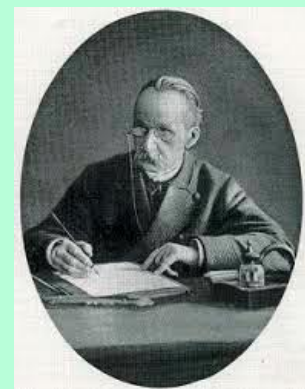
De leraar Seipgens

In Leiden raakt hij bevriend met de hoogleraar Nederlands Jan ten Brink (1834-1901), die net als Seipgens een graf heeft op begraafplaats Groenesteeg.