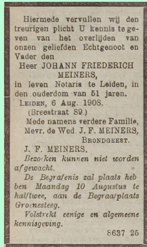
Overlijdensadvertentie (Leidsch Dagblad 7 augustus 1908)