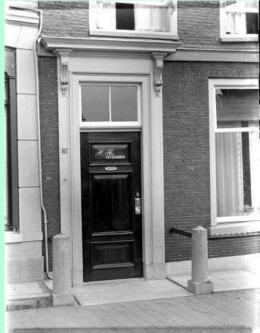
Voordeur Rapenburg 102 (1938)