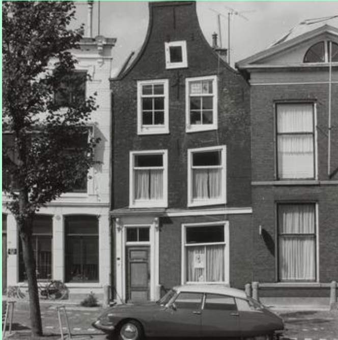
Pand Rapenburg 102 (1974)