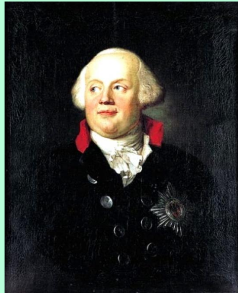
Koning Frederick Wilhelm II