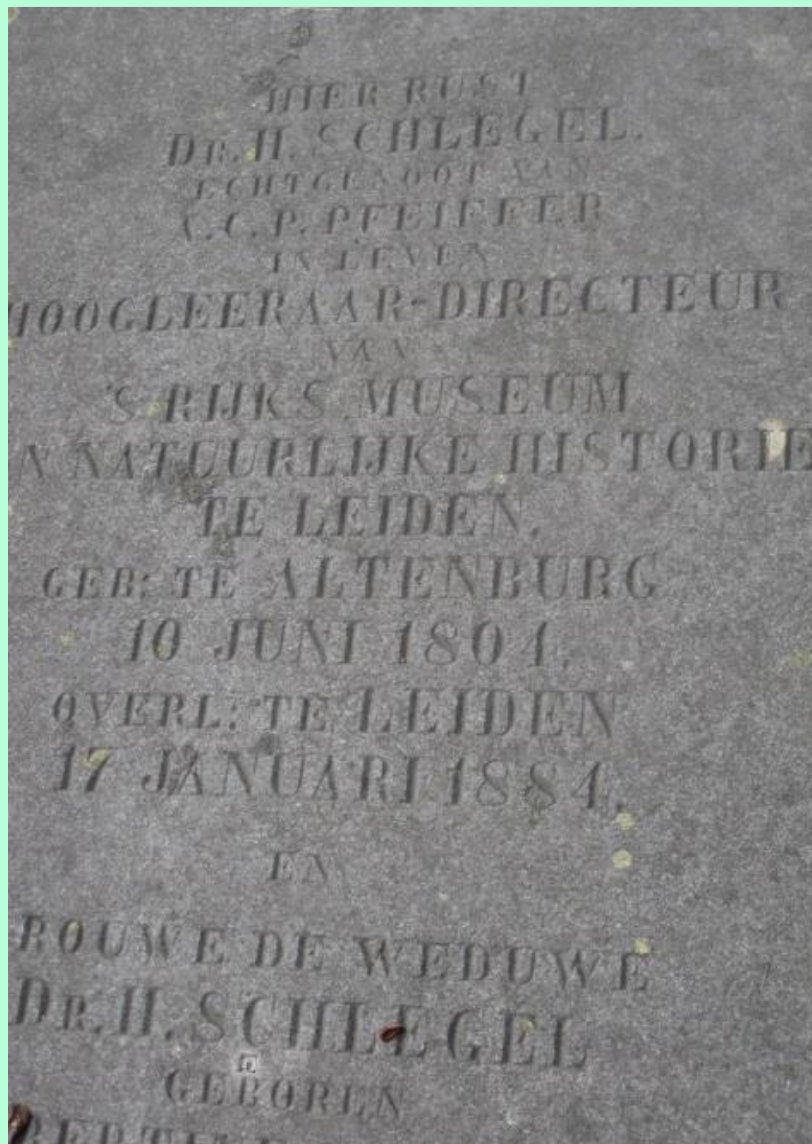
Graf Hermann Schlegel