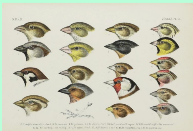
Vogelkoppen, getekend door Hermann Schlegel

In zijn periode als directeur publiceert Hermann 68 artikelen, onder andere De vogels van Nederland beschreven en afgebeeld , met 362 platen.