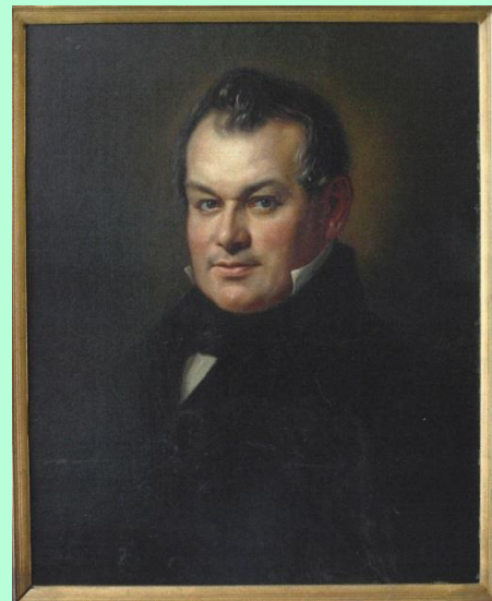
Hermann Schlegel (1851)

Rond 1850 baart Hermann zich zorgen over het opdrogen van de aanvoer uit Nederlands-Indië en over de voortschrijdende leeftijd van Temminck. Hij moet wachten op diens pensioen in de hoop Temmincks plaats te kunnen innemen.