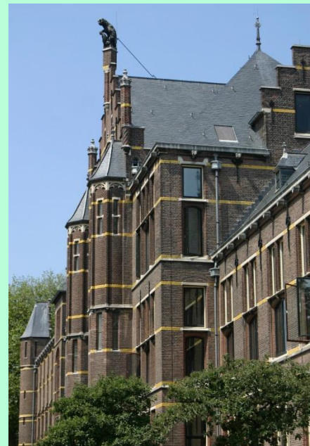
Het museum aan de Raamsteeg

De overheid werkt niet mee aan deze als megalomaan beoordeelde opvatting van Schlegel. Het duurt uiteindelijk tot 1913 dus bijna dertig jaar na het overlijden van Schlegel voordat de nieuwe vestiging aan de Raamsteeg gerealiseerd wordt.