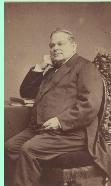
Portret Hermann Schlegel

Schlegel heeft ook contact met de Japan-specialist Von Siebold, een vriend van Temminck, en maakt diverse dienstreizen. In Jena ontvangt hij een eredoctoraat.