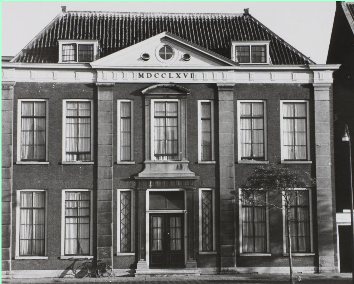
Nosocomium Academicum (Oude Vest 35)

Suringar is secretaris van een commissie die zich bezighoudt met farmaceutische zaken. Hoewel het rapport al in 1844 gereed is, verschijnt het pas officieel in 1851 onder de naam Pharmacopaea Neerlandica . Ook houdt hij zich uitvoerig bezig met het onderwijs in de geneeskunde, waarover hij diverse publicaties schrijft: De opvoeding der zintuigen. Eene bijdrage tot de leer van het onderwijs inzonderheid van de natuur- en geneeskundige wetenschappen (1855) en - in de periode tussen 1860 en 1870 - over de Geschiedenis van het geneeskundig onderwijs te Leiden . Hij beschrijft deze geschiedenis vanaf de oprichting van de universiteit in 1575 tot omstreeks 1865. Het verschijnt in een serie van 18 artikelen in het Nederlands Tijdschrift voor Geneeskunde. Dit werk wordt beschouwd als het beste wat ooit op het gebied van de geschiedenis van de geneeskunde in ons land is verschenen. Het blinkt uit door zijn nauwkeurigheid en zorgvuldige behandeling.