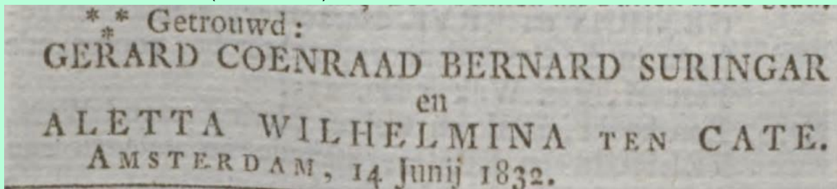
Huwelijksadvertentie (Opregte Haarlemse Courant 16 juni 1832)