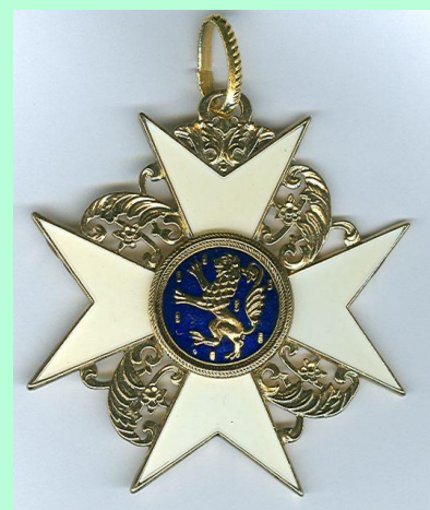
Halskruis van de orde van de Gouden Leeuw van Nassau

In het voorjaar van 1905 smeden enkele vrienden het plan om op Coenens graf een huldeblijk te plaatsen. Het wordt een kleine obelisk, ontworpen door de Amsterdamse kunstenaress Thérèse van Hall.