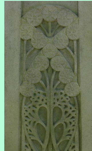
Een drietal details van het grafmonument